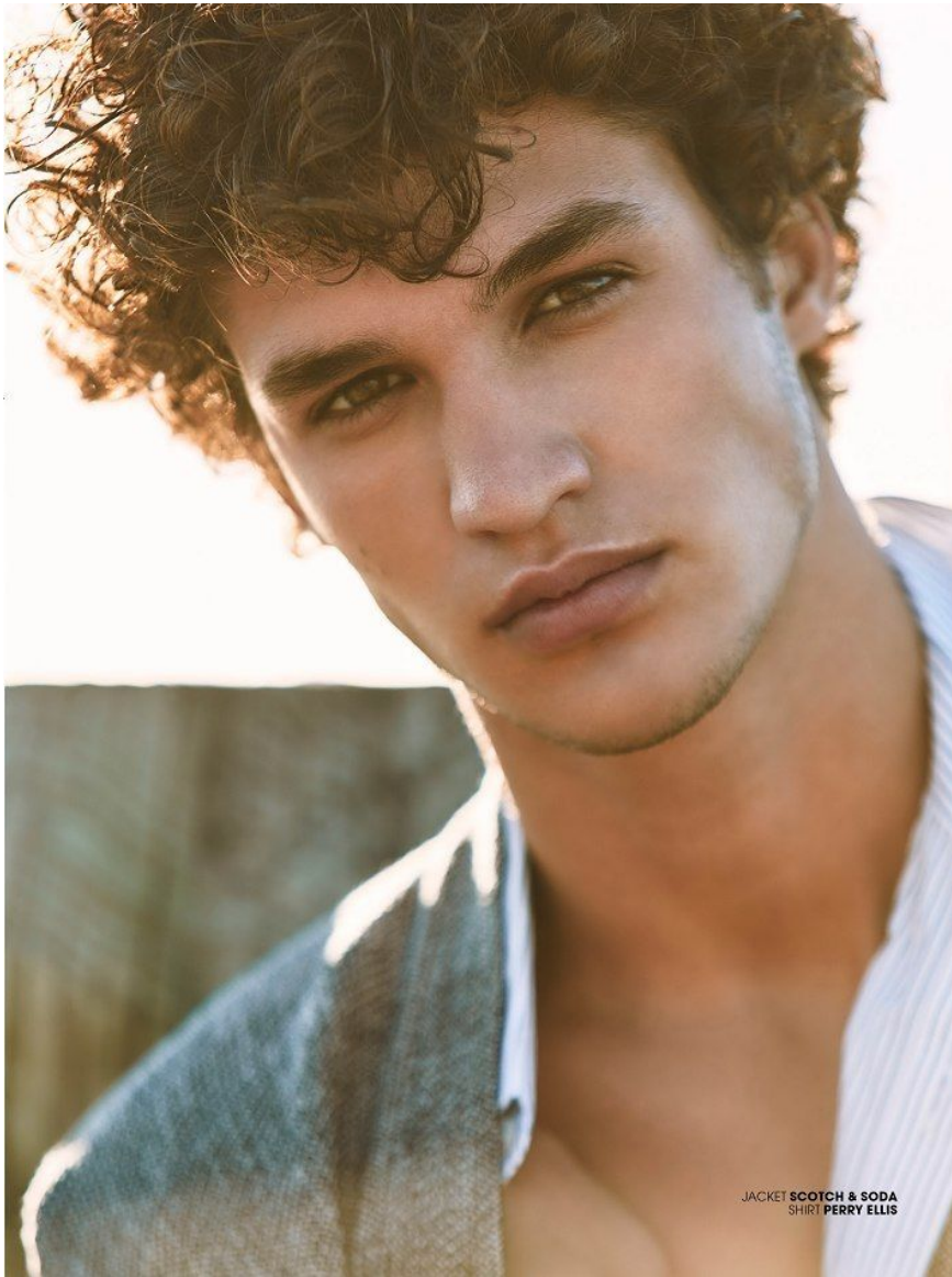
JACKET SCOTCH & SODA SHIRT PERRY ELLIS